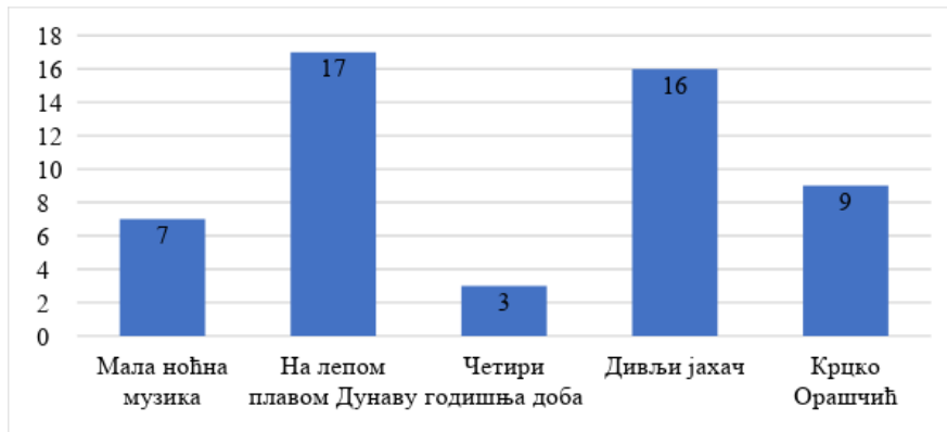
Графикон 2 – одговори ученика о омиљеној композицији.

У Графикону 2 представљени су резултати на питање: „Која ти је омиљена композиција од оних које си до сада слушао/ла?”