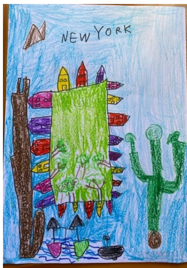
Слика 4. Ликовни рад емоционално ангажованог дјетета

Емоционално ангажована дјеца разликују се по томе што имају слободнији ликовни израз. Примјер цртежа таквог дјетета дат је у наставку рада (Слика 4).