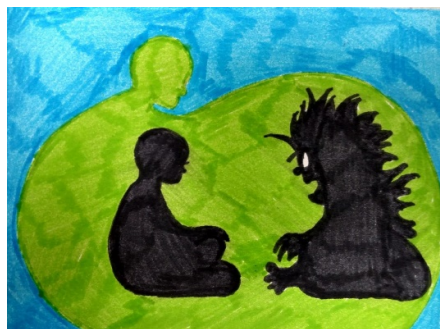
Слика 3. Ликовни рад дјетета као показатељ трауме

Емоционално стање дјетета је такође видљиво кроз ликовно изражавање. Емоционалне сметње се у дјечијим радовима изражавају се кроз константно понављање једне фигуре или детаља, што показује да дијете има потребу да се повлачи у свој свијет у коме се осјећа безбједно, избегавајући нова искуства. Скривене трауме дјетета се најбоље открити управо путем дјечијег цртежа. Да дијете најбоље исказује негативне потиснуте емоције цртежом, најбоље говори наредна слика (Слика 3).