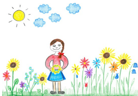
Слика 9. Цртеж у којем су заступљене и топле и хладне боје

буде случај. Примјер адекватно одабраних боја када је у питању дјечији цртеж дат је у наставку рада (Слика 9).