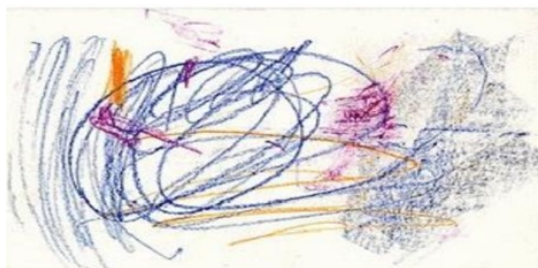
Слика 5. Цртеж дјетета у фази шкрабања

Цртање је један од основних начина испољавања дјечијих емоција. Развој цртања је у уској вези са укупним дјечијим развојем, а нарочито са интелектуалним и развојем личности. Пијаже је заступао став да је цртеж облик симболичке функције који се налази на пола пута између симболичке игре и менталне слике. У цртању као значајној активности разликују се одређене развојне фазе које се развијају и мијењају упоредо са фазама психичког развоја дјетета и развоја његове личности. Први стадијум развоја дјечијег цртања односи се на фазу шкрабања која траје од друге до треће године. Дјеца у овој фази не цртају облике ни конкретан садржај (Слика 5).