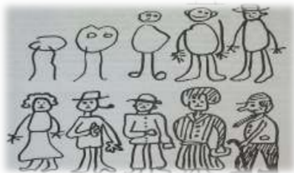
Слика 1. Развој људске фигуре из угла дјетета

Почетком 20. вијека је питање и уједно и изазов тумачења дјечијих цртежа подстакао бројне педагоге, психологе, педијатре и ликовне умјетнике да проучавају карактеристике дјечијег ликовног изражавања које су повезане са личношћу малог умјетника, његовим узрастом и нивоом развоја уопште. Први који је почео са истраживањем и анализом значења дјечијих цртежа био је њемачки педагог Кершенштајнер који је до 1905. године прикупио више од 100000 цртежа дјеце различитог узраста (Марковић и Тодоровић, 2016).