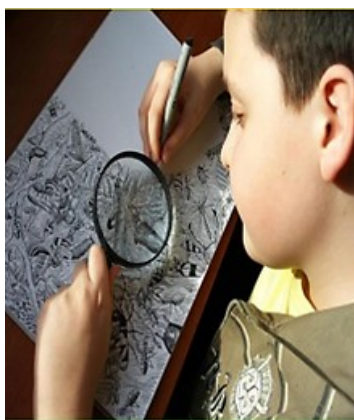
Слика 7. Фаза умјетничког цртања

Отприлике око девете и десете године, цртежи добијају логички смисао. Једна од фаза која се најчешће везује за период од 10 године па надаље је фаза умјетничког цртања. Од ове године најчешће опада интерес за цртање, а надаље је примјетан само код оне дјеце која имају специфичне способности (Слика 7). Реалне слике приказују се из различитих углова, али и у различитим међусобним односима. Пијаже је закључио да дјеца у овом периоду имају могућност да унапријед означе хоризонтални ниво воде у бокалу који се нагиње у различитим правцима, што показује склад између развоја цртежа и интелектуалног развоја. Ипак, било који од наведених стадијума да је у питању, значајно је подстицати дјечије цртање и уопште сваки сегмент ликовног стваралаштва, јер се на тај начин богати дјечије искуство и унапријеђује личност дјетета. Свакако, треба водити рачуна о тренутним потребама дјетета и достигнутом нивоу развоја.