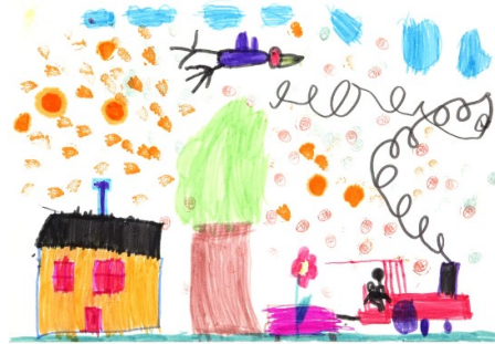
Слика 8. Примјер различите перцепције о величини појединих елемената

Један од значајнијих елемената цртежа је величина цртежа и коришћење детаља. На примјер, дјеца главу људске фигуре често приказују превеликом како би показали што више детаља. Планирање укључивања детаља, осим на релативан однос дијелова исте фигуре, има утицај и на међусобан однос величина самосталних фигура. Дјеца тачно приказују релативне односе неколико ликова, с тим да је нарушен апсолутан однос међу ликовима који су у природи значајно различити по величини, што је примјетно на Слици 8.