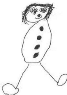
Слика 10. Цртеж седмогодишњег дјечака са проблемом емоционалне неприлагођености

смислу истиче се познати Гудинаф тест цртања људске фигуре. С друге стране, постоје бројни примјери дјечијих цртежа који говоре о одређеном проблему у развоју личности дјетета. Један од таквих примјера приказан је у наставку рада (Слика 10).