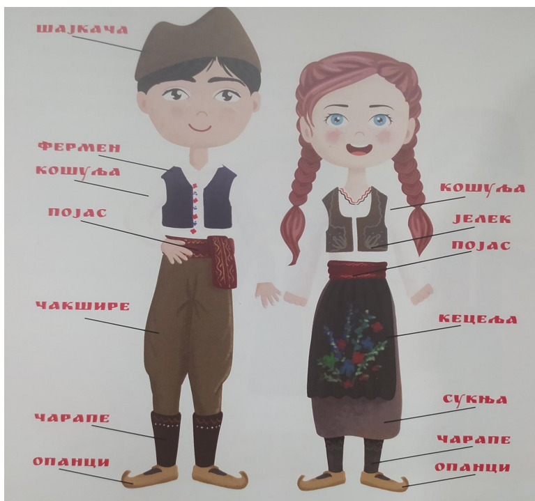
Слика 2: Одјећа и обућа српског народа

Српска народна ношња одавно је ишчезла из свакодневног живота. Данас се ношње могу видјети у музејима или на играчима културно-умјетничких друштава која његују фолклор и традицију нашег народа. Врло је разнолика и сваки крај је имао своју народну ношњу по којој је био препознатљив и разликовао се од осталих. Разлике су биле у материјалима, шарама, облику капе, шарама на кецељама, појасевима, марамама, па чак и по врсти обуће (опанци).