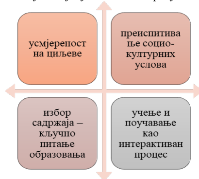
Шема 3. Најзначајније одлике Клафкијеве теорије