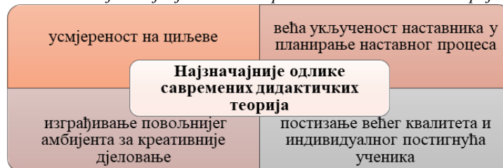
Шема 2. Најзначајније одлике савремених дидактичких теорија

овог дијела рада слиједи преглед најзначајнијих одлика савремених дидактичких теорија по питању планирања и програмирања наставног процеса.