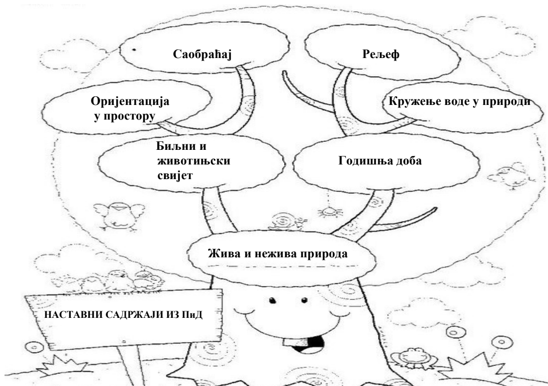
Слика 1. Погодни наставни садржаји за употребу принципа очигледности

Колика је учесталост ових наставних садржаја које су предлагали испитаници видимо у наредној Табели бр.4 .