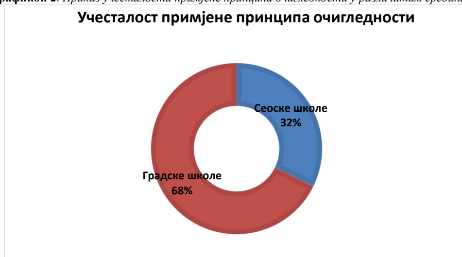
Графикон 2. Приказ учесталости примјене принципа очигледности у различитим срединама

На основу графикана 2 може се видјети колика је учесталост примјене принципа очигледности у различитим срединама, тј. у градским и сеоским школама. У градским школама учитељи су потврдили да је учесталост овог принципа на часовима природе и друштва честа (68%), док у сеоским школама није толико учестала употреба принципа, него је она сведена на