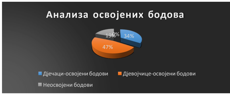
Табела 6. Анализа освојених бодова (укупан број бодова је био 200, односно 40 ученика по 5 мелоритмичких вјежби од којих свака носи по један бод)

Графикон 6. Анализа освојених бодова (укупан број бодова је био 200, односно 40 ученика по 5 мелоритмичких вјежби од којих свака носи по један бод)