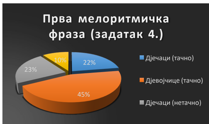
Табела 4. Резултати вокалне репродукције прве мелоритмичке фразе (задатак 4)