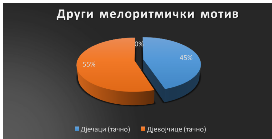
Графикон 2. Резултати вокалне репродукције мелоритмичког мотива (задатак 2)

Из графикана и табеле број 1 видимо да је први мелоритмички мотив вокално репродуковало 35 ученика или 96 одсто, од чега су 60 одсто дјевојџице, односно њих 22 и 36 одсто дјечаџи - њих 13. Тачно није репродуковало 4 одсто ученика и сви су дјечаџи, њих петоро.