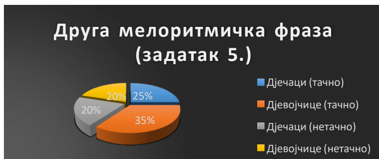
Табела 5. Резултати вокалне репродукције друге мелоритмичке фразе (задатак 5)