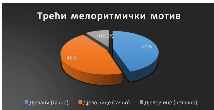
Табела 3. Резултати вокалне репродукције мелоритмичког мотива (задатак 3)