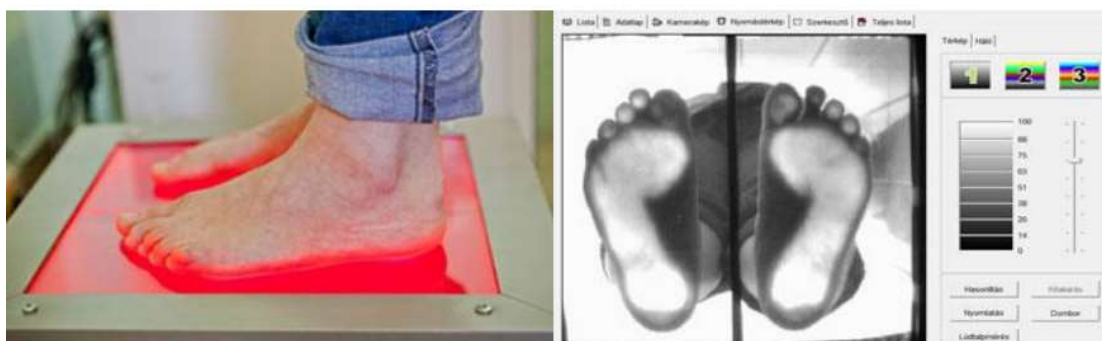
Слика 2. Поступак мјерења